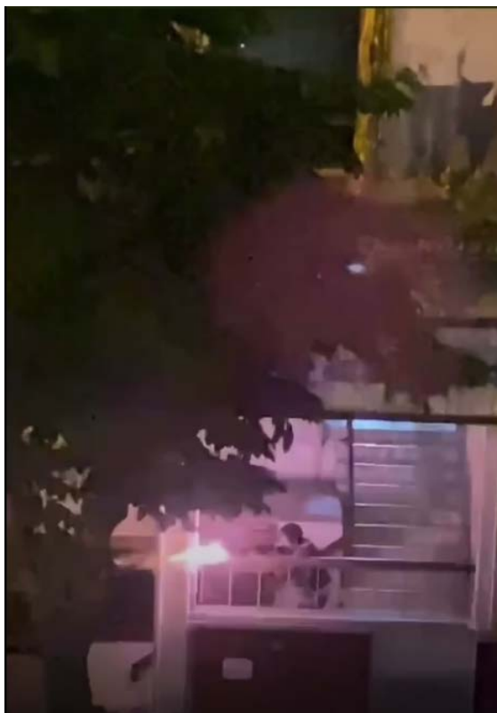
ภาพที่ 16 ชายที่ยิงมาจากบันไดทางขึ้นชั้น 2 ของ สน.ดินแดง