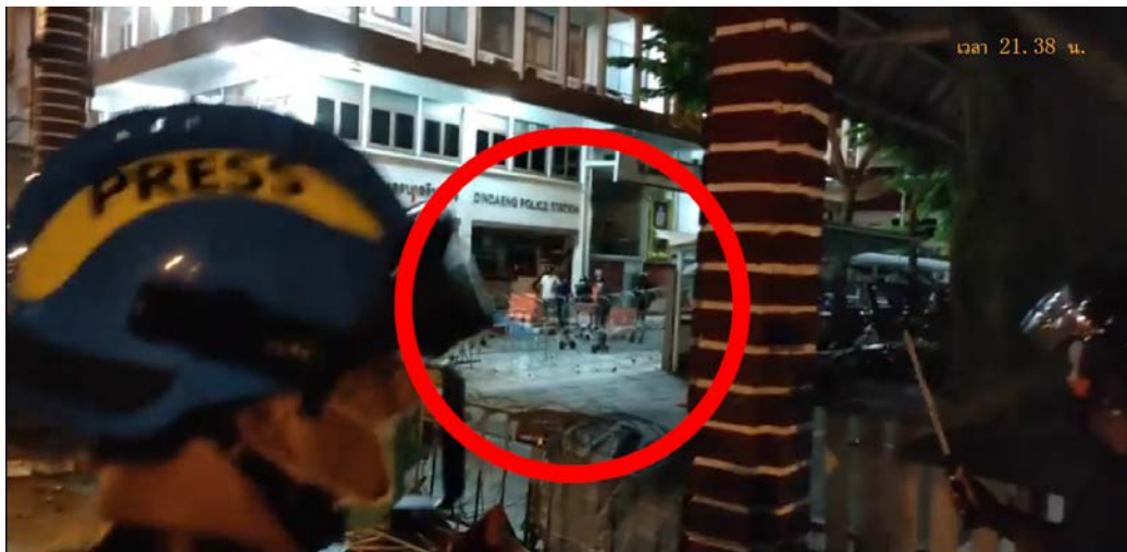
ภาพที่ 22 กลุ่มชายฉกรรจ์หลายคนยืนอยู่ภายในรั้ว สน.ดินแดง

ไม่เพียงเท่านั้น ในช่วงเวลาที่ตำรวจควบคุมฝูงชนสามารถเข้าควบคุมพื้นที่บริเวณแยกโรงกรองน้ำและหน้า สน.ดินแดงได้แล้ว ภาพการถ่ายทอดสดของสำนักข่าวในเพจเฟซบุ๊ก “Thairath – ไทยรัฐออนไลน์” 16 และเพจเฟซบุ๊กของสำนักข่าว The Reporters 17 ซึ่งตรงกับเวลา 21.38 น. พบว่ามีกลุ่มชายฉกรรจ์หลายคนยืนอยู่หน้า สน.ดินแดง และอยู่ภายในรั้ว สน.ดินแดงอีกด้วย โดยกลุ่มชายฉกรรจ์เหล่านี้ไม่ได้ใส่เครื่องแบบตำรวจ ลักษณะการแต่งกายคล้ายกับกลุ่มผู้ก่อเหตุทำร้ายผู้อื่นหน้าปากซอยประชาสงเคราะห์ 14 และกลุ่มที่ไล่ยิงหน้า สน.ดินแดง อีกทั้งยังมีการสวมหมวกกันน็อกเต็มใบเพื่อปิดบังใบหน้าของตนต่างๆ ที่ยืนอยู่ในกลุ่มของเจ้าหน้าที่ตำรวจ ซึ่งในเวลานั้น พื้นที่ สน.ดินแดงมีการปกป้องสูงสุดจากหน่วย คผ. ที่ป้องกันไม่ให้กลุ่มผู้ชุมนุมหรือประชาชนที่ไม่เกี่ยวข้องเข้าไป จึงยอมไม่ใช้วิสัยปกติที่จะมีการอนุญาตให้พลเรือนหรือประชาชนคนใดเข้าไปในพื้นที่ สน.ได้ (ภาพที่ 22 และ 23)