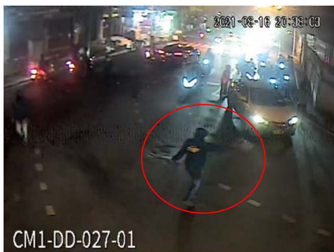
ภาพที่ 6 วงสีแดง แสดงเหตุการณ์ที่ชายถือปืนสั้น วิ่งไล่และยิงปืนใส่วัยรุ่นที่วิ่งหนี

20:38:03 (ch1) หนึ่งในสมาชิกของกลุ่มนี้ ใส่เสื้อแจ็คเก็ตแขนยาวสีเข้ม มีฮู้ด (มีตัวหนังสือขนาดใหญ่ด้านหลัง) กางเกงยีนส์สีน้ำเงิน ใส่หน้ากากอนามัย ถีบปั่นล้อ วิ่งไล่และยิงปืนใส่วัยรุ่นที่วิ่งหนี (ยิงไปในทิศทางเดียวกับที่ ด.ช.ธนพลวิ่งหนี) (ดูภาพที่ 6)