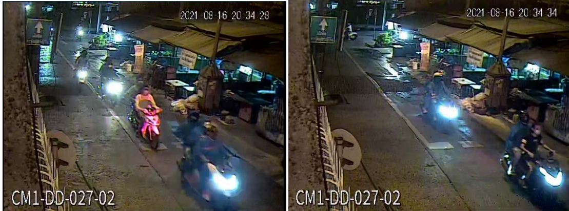
ภาพที่ 3 แสดงกลุ่มผู้ก่อเหตุ 12 คน ขี่รถจักรยานยนต์ 6 คัน

20:34:45 (ch1) หนึ่งในผู้ก่อเหตุ ชายใส่เสื้อยืดสีขาว 14 กางเกงขาสั้นสีเข้ม มือซ้ายถือไม้ยาวราว 3 ฟุต สะพายกระเป๋าสีดำพาดไหล่และลำตัวด้านขวา และในมือขวาถืออาวุธปืนสั้น ยิงปืน 1 นัด แล้วเดินรี่เข้าหากลุ่มผู้ขับขี่จักรยานยนต์ที่จอดอยู่หน้าร้านเซเว่น แล้วใช้ไม้ไล่ฟาดพวกเขา จนพวกเขาขับรถหนีไป (ดูภาพที่ 4)