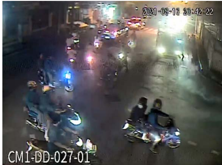
ภาพที่ 9 แสดงทิศทางที่กลุ่มผู้ก่อเหตุขับรถออกจากบริเวณปากซอยประชาสงเคราะห์ 14

20:42:00 (ch1) กลุ่มผู้ก่อเหตุขับรถออกจากบริเวณที่เกิดเหตุไปตามถนนประชาสงเคราะห์ มุ่งหน้าไปทางซอยประชาสงเคราะห์ 21 (ดูภาพที่ 9) (จะกล่าวถึงคนกลุ่มนี้ต่อไปในส่วนที่เกี่ยวข้องกับ ด.ช.วาทธิ์)