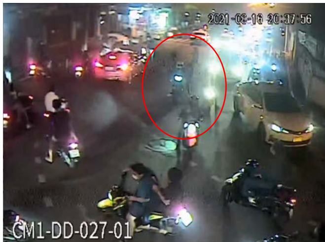
ภาพที่ 5 วงสีแดง แสดงเหตุการณ์ที่ชายเสื้อขาววิ่งเข้ามา แล้วใช้ไม้ฟาดใส่ ด.ช.ธนพลและเพื่อน

20:37:56 (ch1) ด.ช.ธนพลและเพื่อนขี่จักรยานยนต์มาถึงทางโค้งหน้าปากซอยประชาสงเคราะห์ 14 และชะลอรถเพื่อดูเหตุการณ์ อยู่ๆ ชายเสื้อขาววิ่งเข้ามา แล้วใช้ไม้ฟาดใส่ ด.ช.ธนพลและเพื่อน เพื่อนของ ด.ช.ธนพลตัดสินใจลงจากรถแล้วออกวิ่ง ด.ช.ธนพลพยายามประคองรถต่อไปได้อีกเล็กน้อย (ดูภาพที่ 5)