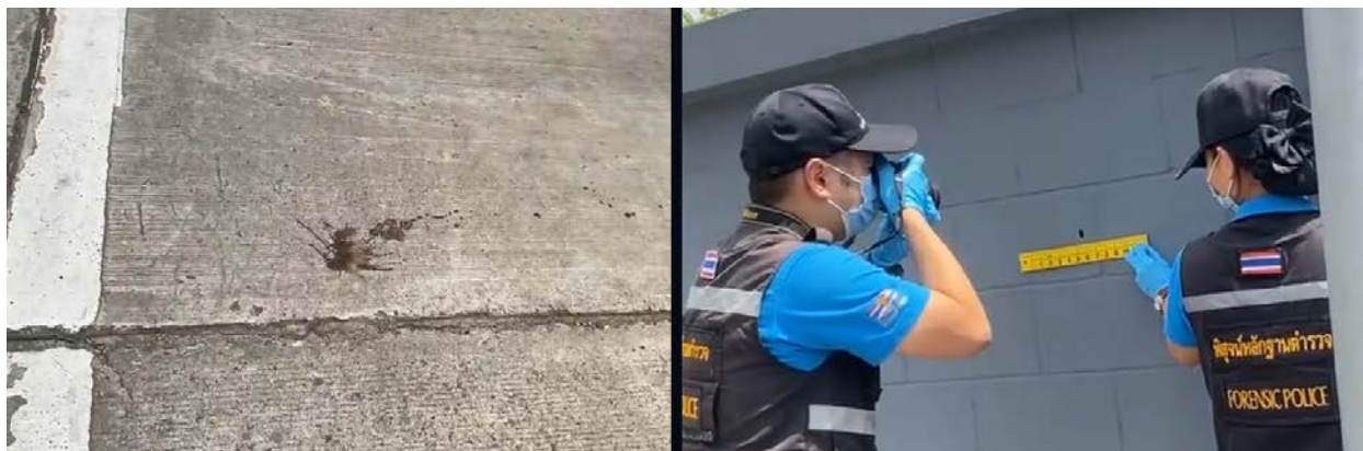
ภาพที่ 17 แสดงรอยโลหิตที่พื้นถนนและรอยกระสุนที่กำลัง