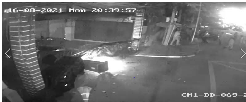
ภาพที่ 12 ผู้ชุมนุมจุดไฟเผาถังขยะพลาสติกและกรวยจราจร

เวลาประมาณ 20.39 จากกล้อง CCTV ของกรุงเทพมหานคร ตำแหน่งปากซอย สน.ดินแดง (ch02) ผู้ชุมนุมจุดไฟเผาถังขยะพลาสติกและกรวยจราจร บนถนนบริเวณแผงเหล็กปิดทางเข้าถนนซอย สน.ดินแดง (ดูภาพที่ 12)