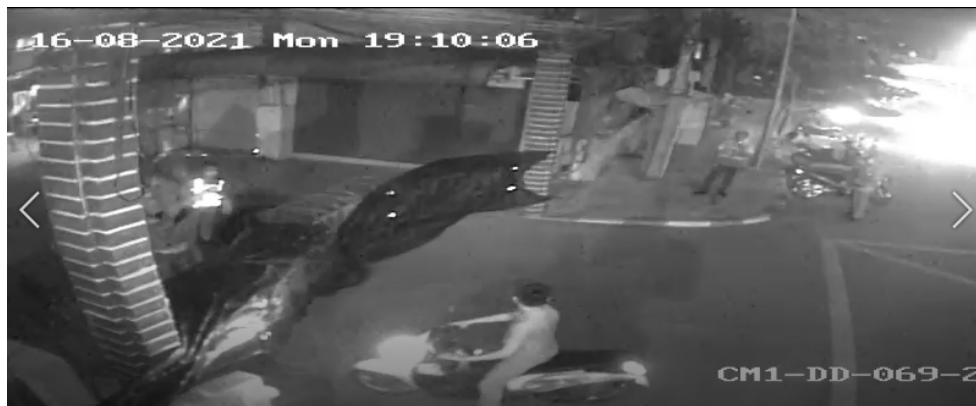
ภาพที่ 10 เจ้าหน้าที่นำแผงเหล็กปิดทางเข้าถนนซอย สน.ดินแดง

เวลา 19.10 น. จากกล้อง CCTV ของกรุงเทพมหานคร ตำแหน่งปากซอย สน.ดินแดง (ch02) พบว่า เจ้าหน้าที่นำแผงเหล็กปิดทางเข้าถนนซอย สน.ดินแดง (ดูภาพที่ 10)