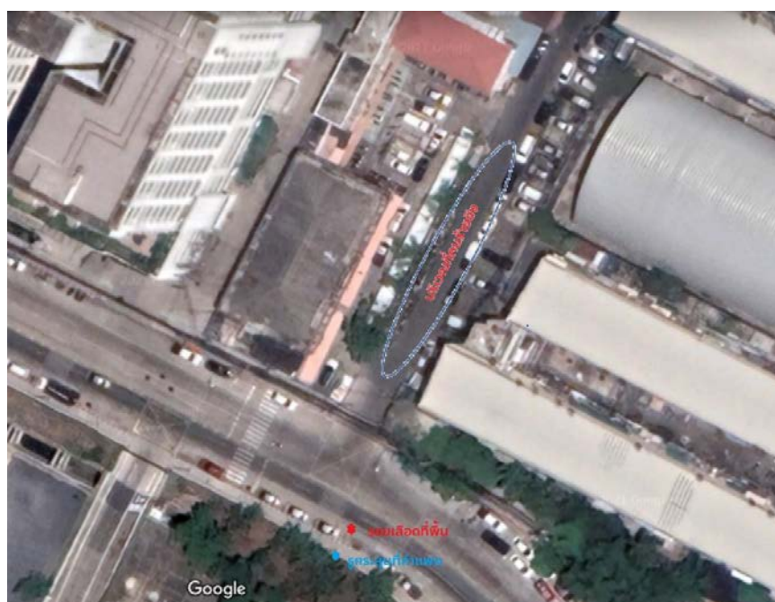
ภาพที่ 18 ภาพจากเว็บไซต์ google map แสดงสถานที่เกิดเหตุ เส้นวงรีแสดงบริเวณที่เชื่อว่าคนร้ายใช้อาวุธปืนยิง ● แสดงตำแหน่งรอยโลหิตที่พื้น ● แสดงตำแหน่งรูกระสุนที่กำลัง

https://web.facebook.com/watch/live/?v=370152964604830&ref=watch_permalink&t=347 .)