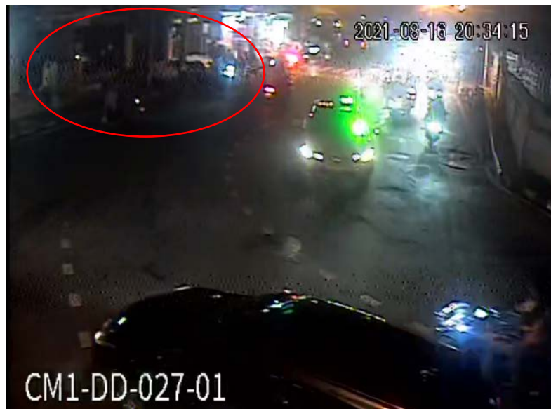
ภาพที่ 2 วงสีแดง แสดงกลุ่มผู้ชุมนุมที่จับกลุ่มอยู่บริเวณทางม้าลาย

20:34:15 (ch1) กลุ่มผู้ขับขี่จักรยานยนต์ราว 10 คันขับมาจากด้านสามแยกโรงกรองน้ำ กลับรถแล้วหยุดจับกลุ่มอยู่บริเวณทางม้าลาย หน้าร้านเซเว่น (หรือปากซอยประชาสงเคราะห์ 12) สันนิษฐานว่าพวกเขาเป็นผู้ชุมนุม (ดูภาพที่ 2)