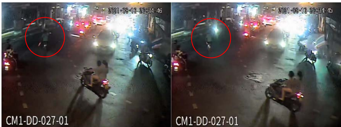
ภาพที่ 4 วงสีแดง ภาพซ้าย แสดงลักษณะผู้ก่อเหตุที่ใช้มือขวาถืออาวุธปืนและมือซ้ายถือไม้ยาว วงสีแดง ภาพขวา แสดงประกายไฟจากกระบอกปืน

20:34:45 (ch1) หนึ่งในผู้ก่อเหตุ ชายใส่เสื้อยืดสีขาว 14 กางเกงขาสั้นสีเข้ม มือซ้ายถือไม้ยาวราว 3 ฟุต สะพายกระเป๋าสีดำพาดไหล่และลำตัวด้านขวา และในมือขวาถืออาวุธปืนสั้น ยิงปืน 1 นัด แล้วเดินรี่เข้าหากลุ่มผู้ขับขี่จักรยานยนต์ที่จอดอยู่หน้าร้านเซเว่น แล้วใช้ไม้ไล่ฟาดพวกเขา จนพวกเขาขับรถหนีไป (ดูภาพที่ 4)