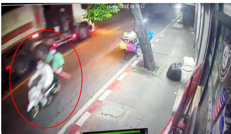
ภาพที่ 19 ภาพจากกล้องวงจรปิดของร้านเซเว่นอีเลฟเว่น ปากซอยประชาสงเคราะห์ 21 วงสีแดง เป็นรถคนร้ายที่ก่อเหตุที่ซัดมาคันแรก

จากการตรวจสอบกล้อง CCTV ของกรุงเทพมหานคร ตำแหน่งปากซอยประชาสงเคราะห์ 21 ในเวลาใกล้เคียงกัน พบเห็นรถจักรยานยนต์ทั้ง 6 คันของกลุ่มผู้ก่อเหตุหน้าปากซอยประชาสงเคราะห์ 14 ได้มุ่งหน้าไปยังถนนประชาสงเคราะห์ และเลี้ยวเข้าซอยประชาสงเคราะห์ 21 ซึ่งเป็นซอยที่เชื่อมต่อกับด้านหลังของซอยหน้า สน.ดินแดง (ดูภาพที่ 19)