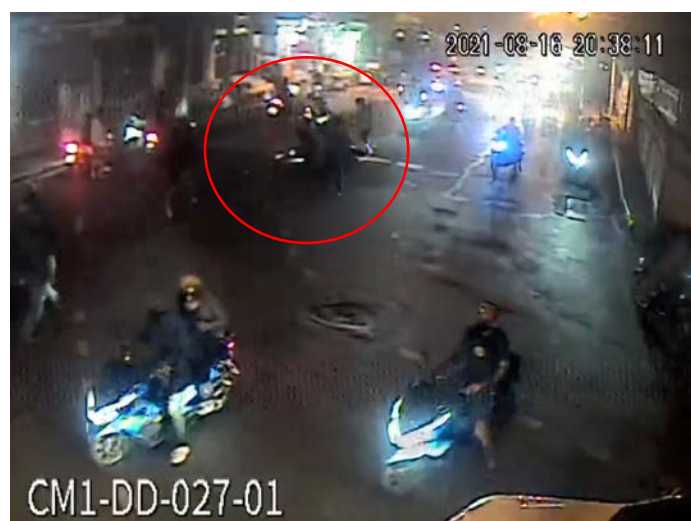
ภาพที่ 8 วงสีแดง แสดงเหตุการณ์ที่กลุ่มผู้ก่อเหตุยังคงคุกคามผู้ขี่จักรยานยนต์ที่ขี่ผ่านมาต่อไป

ผู้ขี่จักรยานยนต์รายหนึ่งถูกตีจนรถล้มลงกลางถนน ผู้ขี่ขี่ตัดสินใจทิ้งจักรยานยนต์ แล้ววิ่งหนีไปทางถนนประชาสงเคราะห์ โดยมีชายเสื้อดำใส่ชุดถือปืน เดินย้อนกลับมา เล็งปืนใส่ผู้ขี่ขึ้นบนท้องถนน (ดูภาพที่ 8)