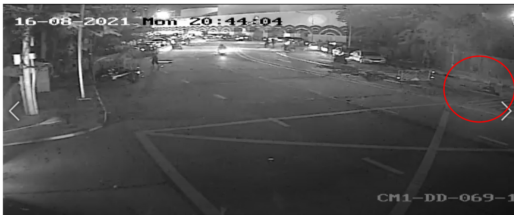
ภาพที่ 14 วังสีแดง ด.ช.วาฤทธิ์ ล้มลงกับพื้น

เวลา 20:44:04 จากกล้อง CCTV ของกรุงเทพมหานคร ตำแหน่งปากซอย สน.ดินแดง (ch01) ด.ช. วาฤทธิ์ ล้มลงกับพื้น ตำแหน่งตรงข้ามปากซอย สน.ดินแดง ช่องจราจรชิดฝั่งศาลาว่าการกรุงเทพมหานคร ขณะกำลังวิ่งมุ่งหน้าโรงกรองน้ำ (ดูภาพที่ 14)