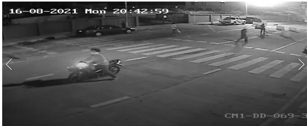
ภาพที่ 13 ผู้ชุมนุมบางส่วนนำแผงเหล็ก แบรีเออร์พลาสติก มาวางบนกลางถนนมิตรไมตรี

เวลา 20:44:04 จากกล้อง CCTV ของกรุงเทพมหานคร ตำแหน่งปากซอย สน.ดินแดง (ch01) ด.ช. วาฤทธิ์ ล้มลงกับพื้น ตำแหน่งตรงข้ามปากซอย สน.ดินแดง ช่องจราจรชิดฝั่งศาลาว่าการกรุงเทพมหานคร ขณะกำลังวิ่งมุ่งหน้าโรงกรองน้ำ (ดูภาพที่ 14)