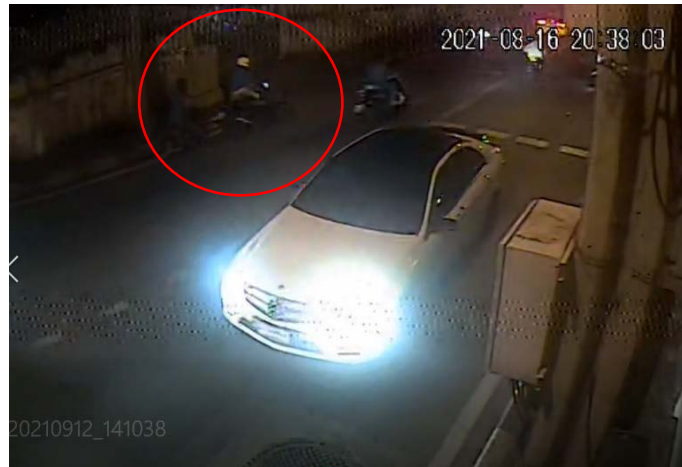
ภาพที่ 7 วงสีแดง แสดงเหตุการณ์ที่ ด.ช.ธนพล ตัดสินใจจอดรถแล้วลงวิ่ง ทิ้งรถไว้

จากกล้อง CCTV ของกรุงเทพมหานคร หน้าปากซอยประชาสงเคราะห์ 14 ที่เข้ามาทางถนนประชาสงเคราะห์ด้านขวา แสดงให้เห็นว่าเมื่อพ้นหัวโค้งถนน ด.ช.ธนพลได้ตัดสินใจจอดรถแล้วลงวิ่ง ทิ้งรถไว้ข้างถนนฝั่งซ้าย โดยมีชายถือปืนกับพวกไล่ตามมาติดๆ (ดูภาพที่ 7)