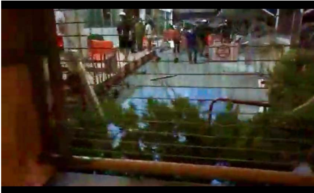
ภาพที่ 23 กลุ่มชายฉกรรจ์หลายคนยืนอยู่ในน้ำ สน.ดินแดง อีกมุมหนึ่ง

คำถามคือ คนกลุ่มนี้เป็นใคร ใช้กลุ่มเดียวกับกลุ่มคนที่ก่อเหตุหน้าปากซอยประชาสงเคราะห์ 14 และหน้า สน.ดินแดงในช่วงไม่กี่นาทีก่อนหน้านี้อีกหรือ พวกเขามีความสัมพันธ์กับเจ้าหน้าที่ตำรวจ สน.ดินแดงหรือไม่อย่างไร